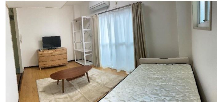
（実際の居室には家具等設置していません）